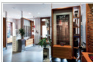
DICK OPTIQUE La Chaux-de-Fonds