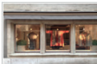
STUDIO CACHEMIRE à Genève

» Genève : Une Part de Bonheur pendant 4 jours à the Square