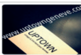
UPTOWN VINTAGE STORE Genève